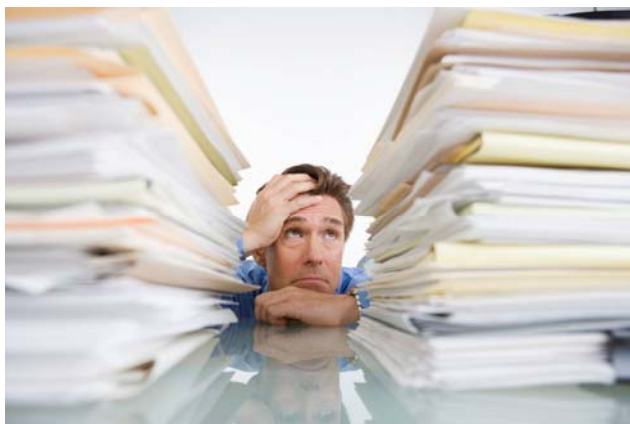
Da „sindrom prepunog stola“ postane prošlost

SS BOFOS izabrana je za partnersku organizaciju koja će biti uključena u realizaciju projekta pod nazivom "Mreža za zdravlje i sigurnost na radu". Nosilac projekta (finansiranog iz pretpripravnog fonda IPA 2008 – Civil Society Facility) je „Udruga za pomoć i edukaciju žrtava mobbinga“ iz Hrvatske, a ostale dve partnerske organizacije koje će se angažovati na projektu su Sindikat finansijskih dejnosti iz Makedonije i Sindikat finansijskih organizacija iz Crne Gore.