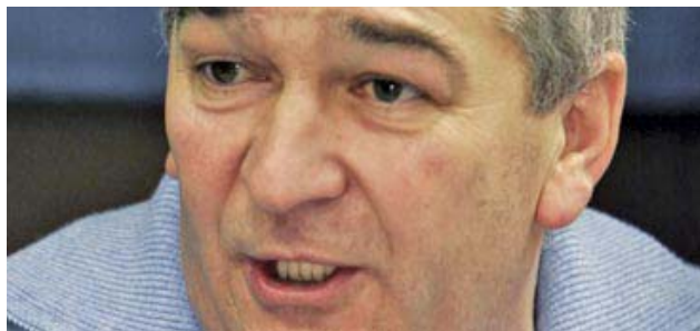
Na sceni- loša privatizacija

Bez obzira šta kažu ministri, svi štrajkovi su bili potpuno opravdani, pa čak i štrajk komunalaca u Novom Sadu koji su tražili da im se ne smanjuje plata. Svi ti štrajkovi su i ekonomsko i socijalno opravdani, a razlog tome su loša privatizacija, neuplaćivanje doprinosa, zdravstvenog osiguranja, uništavanje firmi, pa i pljačka tih firmi – kazao je Orbović.