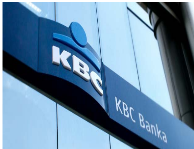
KBC Grupa - prisutna na više od 35 tržišta širom sveta

Određen broj zaposlenih u KBC banci potpisali su pristupnice SS BOFOS-a još u decembru prošle godine, a ubrzo se javila želja njihovih kolega za formiranjem Sindikalne organizacije.